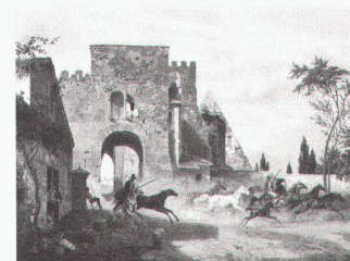
Ludwig Max Prätorius: Die Porta S. Paolo und die Cestiuspyramide in Rom, 1847

Ludwig Max Prätorius – Reisen nach Rom 1844–1856 bis 15.5.