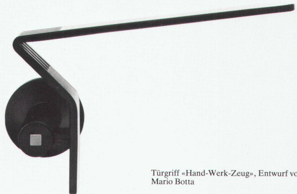
Türgriff «Hand-Werk-Zeug», Entwurf von Mario Botta