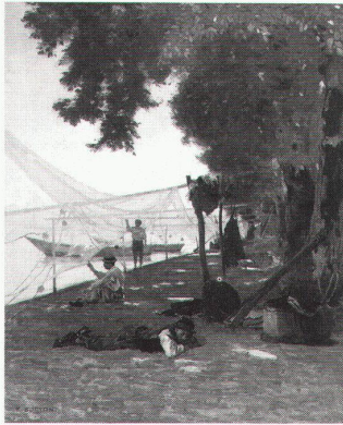
François Boccion, Filets et pêcheurs, vers 1877

Royal Academy of Arts London Italienische Kunst im 20. Jahrhundert bis 9.4. Royal Treasures of Sweden 1550–1700 bis 18.6.