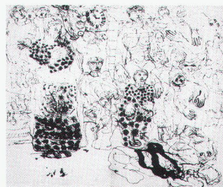
Carl Fredrik Hill

Carl Fredrik Hill – Œuvres provenant du Musée de Malmö bis 27.8.