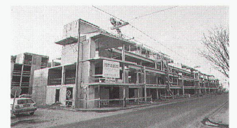
Wohnbebauung an der Brunnerstrasse,

Bei den Angaben zu den Pro- jektverfassern konnte der Eindruck entstehen, dass beide Wohnbebauun- gen von Helmut Richter und Heidulf Gerngross gemeinsam entworfen wurden (nur in der Legende wurden die Projektverfasser korrekt aufge- führt). Für die Wohnbebauung Gräf und Stift zeichneten Helmut Richter und Heidulf Gerngross gemeinsam, für die Wohnbebauung an der Brun- nerstrasse Helmut Richter.