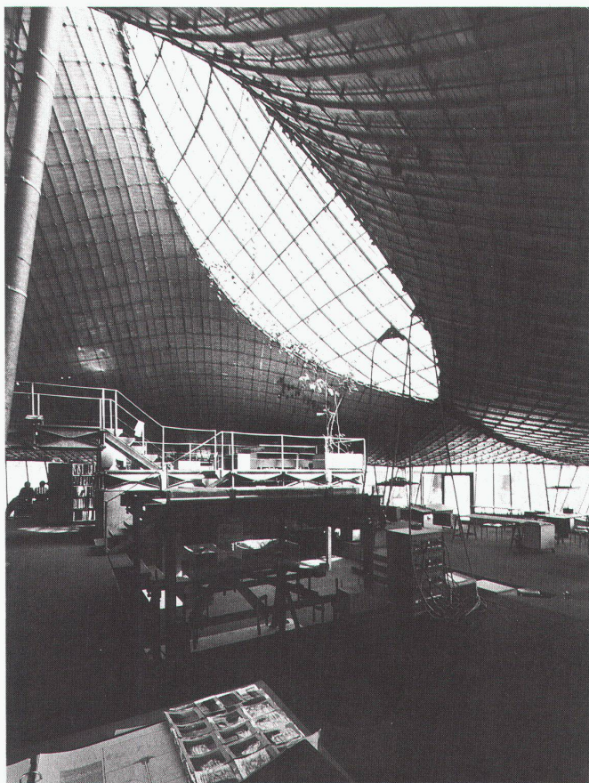
Institut für leichte Flächentragwerke, Universität Stuttgart

Das Forum-Prinzip: Das bewährte Forum-Prinzip des Sehens und Beurteilens aller ausgestellten Produkte unter gleichen Bedingungen schafft einerseits den neutralen Überblick und fördert den kritischen Durchblick. Ein Konzept, das vom Fachhandel sehr positiv beurteilt wurde. Es geht hier nicht um Image,