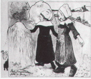
Paul Gauguin, The Joys of Brittany, 1889