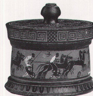
Attische Pyxis mit schwarzen Figuren

Le Corps et l'esprit – Trésors de la Grèce antique bis 15.7.