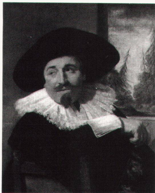
Frans Hals, Isaac Abrahamsz Massa (1626)

Royal Academy of Arts London Frans Hals – 66 Gemälde und Ölskizzen bis 8.4.