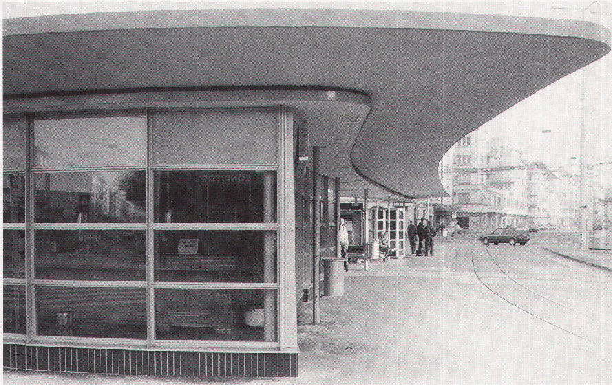
3 Ansicht von Westen / Vue de l'ouest / View from the west