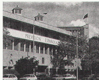
Das Versicherungsgebäude «Prevision Española» in Sevilla (Arch. R. Moneo)

Preis pro Teilnehmer im Doppelzimmer: ohne New York Fr. 5250.–, mit New York Fr. 5900.–.