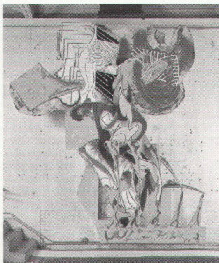
Frank Stella: «The Right Whale's Head.» Mixed Media on Fabricated Aluminium, 1988