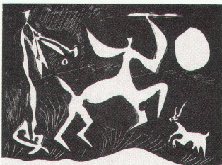
Bündner Kunstmuseum: Pablo Picasso, Centaur dansant, 1948

Pablo Picasso – Druckgraphik 1905–1970 bis 14.9.