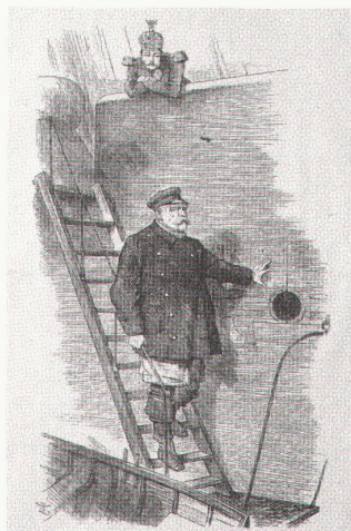
Sir John Teniel, Dropping the pilot, Karikatur in «Punch», März 1890