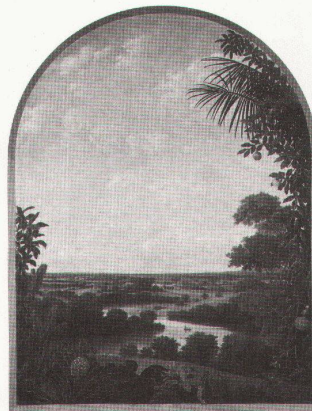
Tübingen: Frans Post, Brasilianische Landschaft

New York, The Metropolitan Museum of Art Italian Renaissance Frames bis 6.1.1991 Art of Central Africa bis 4.11.