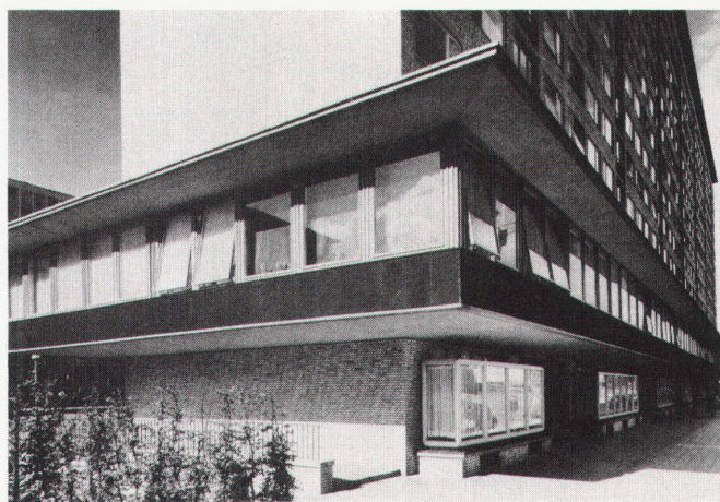
Block 1 von Nord-Osten, Detail

Das Themenheft Nr. 6 zeigt Beispiele und Ansätze zur Koexistenz in den Metronarbeitsbereichen Verkehr, Aussenraum und Siedlung. Es richtet sich an Fachleute, Behörden und Interessierte. Zu beziehen bei: Metron AG, 5200 Windisch, Steinackerstrasse 7, Tel. 056/41 41 04