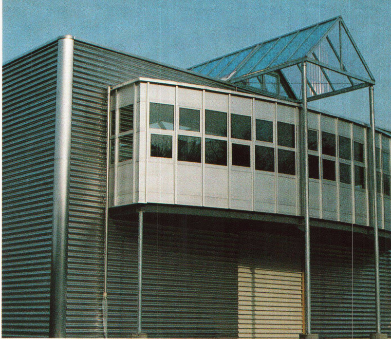
Bauherr: Zvahlen Metallbau, Münchenbuchsee, Architekt: Bruno Am AG, Münchenbuchsee, Unternehmer: Ediltecnica AG, SchönholzhüBE.

Bitte senden Sie uns nähere Unterlagen zum Wellband SP 42 Sinus Name: _____ Vorname: _____ Firma: _____ PLZ/Ort: _____ Strasse: _____ Einsenden an: Montana Bausysteme AG, 5303 Würenlingen