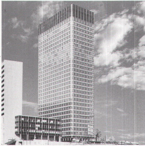
Tour Nobel Paris 1967/68, Vor-Hängefassade Jean Prouté C.I.M.T.