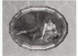
Dortmund, Salome, Farbdruck der Kunst- anstalt Wandsbek bei Hamburg, um 1925

Jeanne Mammen. Gemälde, Aqua- relle und Grafiken der Berliner Rea- listin bis 23.6.