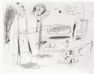
Marseille, Centre de la Vieille Charité: Arshile Gorky. Atre en Virginie, 1946

Marseille, Centre de la Vieille Charité De la danse libre vers l'art pur Les danses tracées – Dessins et nota- tions des choréographes bis 9.6. Arshile Gorky – œuvres sur papier 1929–1947 bis 30.5.