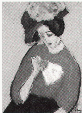
Museum Wiesbaden, Alexej von Jawlensky, Dame mit Fächer, 1909

Schweizerwelt. Plakate aus der Sammlung 10.7.–25.8.