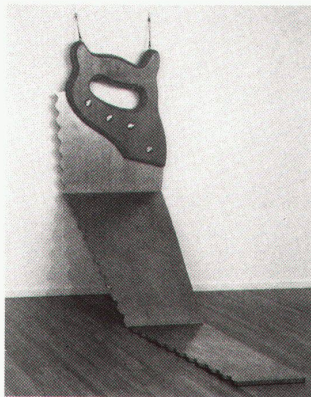
Claes Oldenburg. Saw (Hard Version), 1969