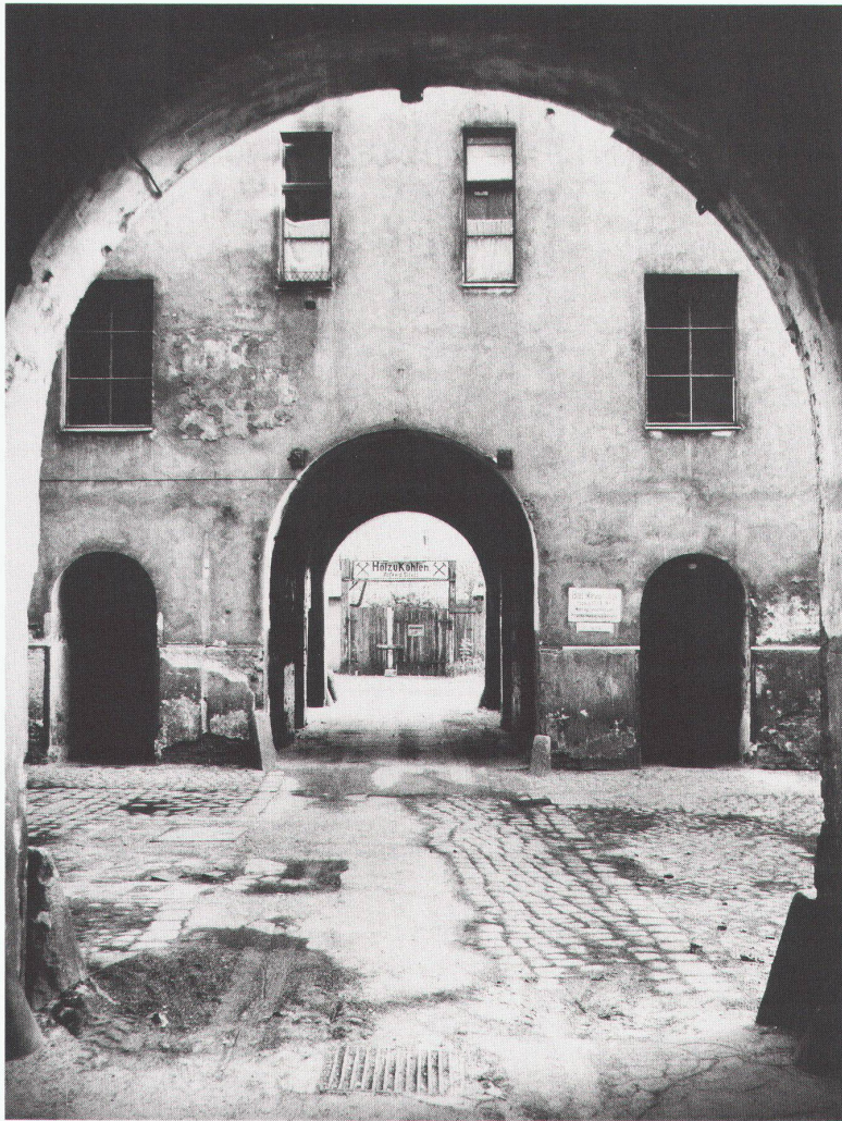
Ein alter Berliner Hof Une vieille cour berlinoise An old Berlin courtyard