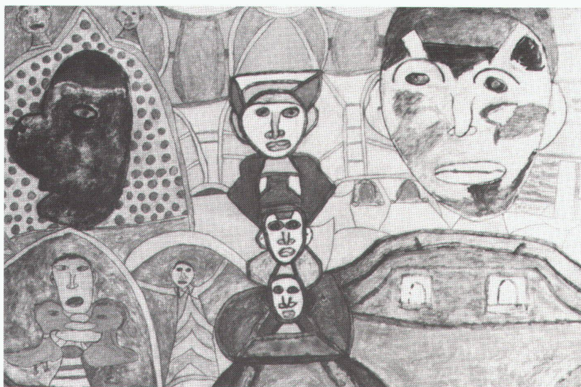
Lausanne, Collection de l'art brut: La Tinaia (Ausschnitt)

Düsseldorf, Kunstsammlung Nordrhein-Westfalen Wassily Kandinsky. Arbeiten auf Papier bis 10.5.