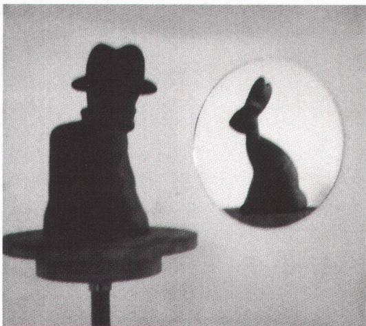
Genève, Cabinet des estampes: Markus Raetz, Sans titre, 1991

Düsseldorf, Kunstverein Grenville Davey: Skulpturen bis 22.3.