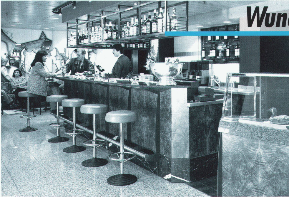
Bar Grand Cru, Hauptbahnhof Zürich / Projekt: Inter-Factory-Design

...sind unsere Bars! Schliesslich zählen die 25 Jahre praktische Erfahrung im Bar-Bau auch für Sie: Professionelle Beratung, Planung und Realisation aus einer Hand, termingerechte und saubere Ausführung bis zum Auftragsende. Und immer für Sie da, wenn es um individuelle Sonderwünsche geht!