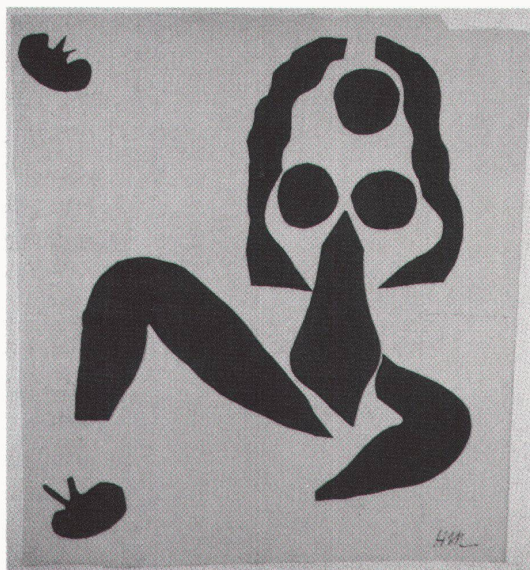
Basel, Kunstmuseum und Kunsthalle: Transform – Henri Matisse

Kassel, Ballhaus am Schloss Wilhelmshöhe Von Küste zu Küste: Präkolumbische Skulpturen aus Meso-Amerika bis 18.10.