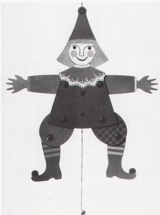
Schloss Oberhofen: Hampelmann, Teddybär & Co, Spielzeug-Ausstellung

Chicago, Museum of Contemporary Art Lorna Simpson: For the Sake of the Viewer bis 8.11.