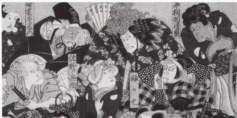
Steinau, Schloss: Utagawa Kunisada (1786–1865) «Theaterblatt, mit dem Schauspieler Nakamura Utaemon», um 1838

Stuttgart, Württem- bergischer Kunstverein Andy Warhol: Ausgesuchte Fotografien der 60er und 70er Jahre bis 11.10.