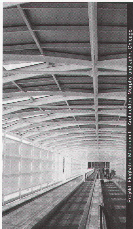
Projekt: Flughafen München II - Architekten: Murphy und Jahn, Chicago

Stahl und Glasbauten in architektonisch perfekter Vollendung schaffen neue Lebensräume für unsere Umwelt. Wir verwirklichen kreative Ideen mit höchsten Anforderungen an Materialien und Ausführung.