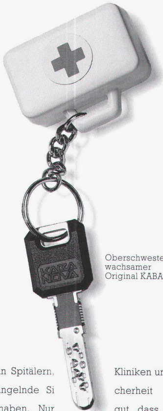
Oberschwester Silvias wachsamer Original KABA® NOVA.

Gerade in Spitälern, kann mangelnde Si- cherheit schwere Folgen haben. Nur gut, dass es KABA® NOVA gibt. Denn dank der an Ort und Stelle program- mierbaren Elektronik von KABA® NOVA lässt sich die Zutrittsberechtigung örtlich und zeitlich limitieren und das Öffnen der Türen sogar registrieren. Und sollte ein- mal ein Schlüssel verloren gehen oder abhanden kom- men, so ist auch dies kein aufregender Notfall: Ohne grosse Operation ist der Schlüs- sel-Code gesperrt und die Anlage neu programmiert. Und schon ist das Schliesssystem wieder wohlauf und wohlzu.