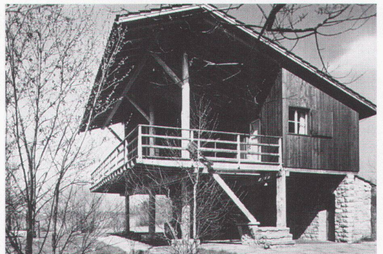
Ferienhaus Müller, Schenkon; Architekt G. Panozzo