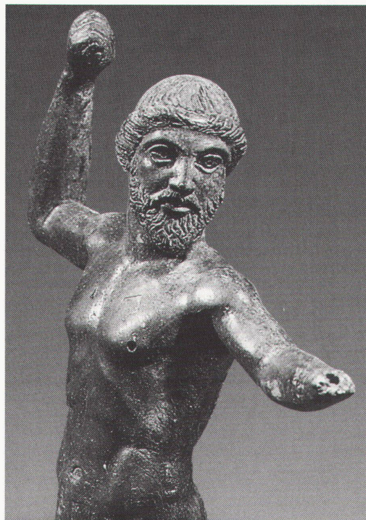
Chur, Rätisches Museum: Statuette des Zeus aus Apollonia, um 460 v.Chr., Bronze

Köln, Josef-Haubrich-Kunsthalle Anton Räderscheidt (1892-1970). Retrospektive bis 29.8. Renate Göbel. Chelsea People bis 22.8.