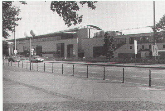
Haus der Geschichte der Bundesrepublik Deutschland, Architekten: Hartmut und Ingeborg Rüdiger, Bauzeit 1989–1993, Eröffnung Frühjahr 1994

Bei seinem Regierungsantritt 1982 hatte Bundeskanzler Helmut Kohl, ganz dem Zeitgeist verpflichtet, in der Phase des Museumsbaubooms von einer Sammlung der deutschen Geschichte seit 1945 gesprochen. Ende 1985 wurde ein Architektenwettbewerb ausgeschrieben, um der im Entstehen begriffenen Sammlung ein festes Haus zu geben. Das in Braunschweig lebende und arbeitende junge Architektenehepaar Hartmut und Ingeborg Rüdiger, die noch nicht auf die abschreckende Geschlossenheit eines Gesamtworks zurückschauen können, gingen mit dem Blick nach vorne aus dem bundesoffenen Wettbewerb als Sieger hervor. Nach einer Überarbeitung ihrer Planung und einer dreijährigen Bauzeit wurde jetzt, 10 Jahre später, der Kohlsche Gedanke in Beton gegossen, in Eisen gesetzt und mit Platten verkleidet. Im Juni 1993 konnte der fertige Bau der Öffentlichkeit vorgestellt werden. Das Haus der Zeitgeschichte steht an der sogenannten «Museumsmeile» (Adenauerallee), vis-à-vis vom Bundeskanzleramt, und schliesst die Lücke zwischen dem Museum König (1911–1913) im Norden und dem Städtischen Kunstmuseum Bonn von Axel Schultes und der Bundeskunsthalle von Gustav Peichl im Süden. Die Museumsmeile lädt aber kaum zum Flanieren ein, wie der Name suggeriert, denn über die frühere Diplomatentreibbahn, wie die Adenauerallee vor den Museumsbauten bezeichnet wurde, quält sich hier und heute der Verkehr – den übrigens die Anwohner seit