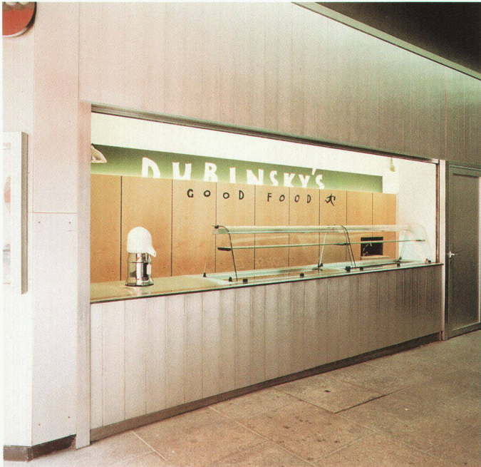
Kiosk Dubinsky's good food, Bahnhofstrasse, Zürich, 1993 (mit L. A. Rothkopf)