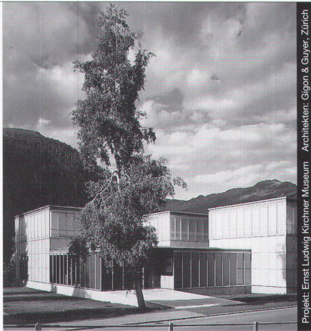
Projekt: Ernst Ludwig Kirchner Museum Architekten: Gigon & Guyer, Zürich