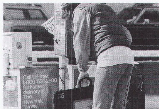
Willie Doherty, «Enduring», 1992