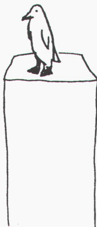
Frankfurt, Museum für moderne Kunst: Stephan Balkenhol, Ohne Titel, 1991

Nürnberg, Germanisches Nationalmuseum Kunst des Sammelns. Das Praunsche Kabinett. Meisterwerke von Dürer bis Carracci bis 15.5.