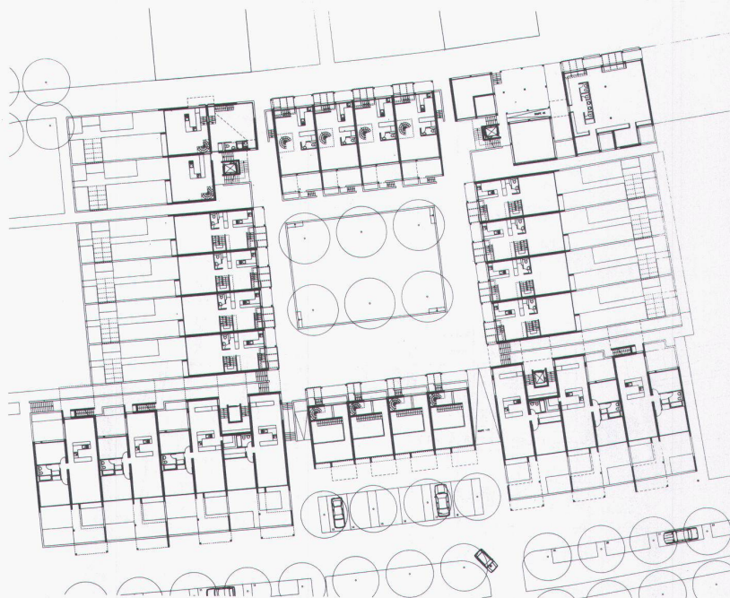
Ebene 1 Niveau 1 Level 1

■ Bodenacker housing scheme, Bremgarten by Berne, project 1987 The residential area situated on a plateau bordered by a steep slope is interspersed by clearly delimited, basically car-free public spaces and is defined by three utilisation levels: 1. living and business areas (noise-protection for the apartments to the rear) along Kalchackerstrasse; 2. communal premises along the central axis; and 3. recreation and leisure areas which are located along the bottom of the slope and extend into the residential area. The buildings are organised in rows of two- and three-storey living units and above them single-storey apartments. The projected structure of the houses, each with the option of its own access to almost every axis, facilitates subdivision of the site into various plots of land and freehold apartments. Construction of the development is planned over two to three stages.