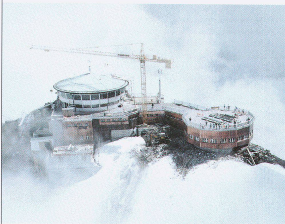
Schilthorn Gipfelstation, Architekt A.F. Feuz