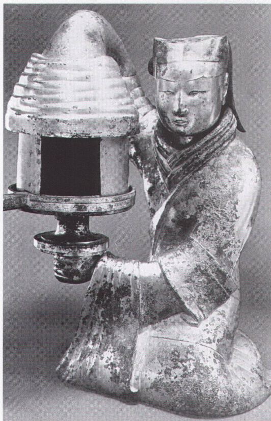
Hildesheim, Roemer- & Pelizaeus-Museum: Dienerin mit Lampe, Bronze, vergoldet

Firenze, Casa Buonarroti Michelangelo nell'Ottocento bis 31.10.