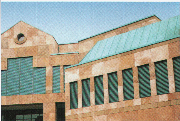
SEGA-Bank Olten, Architekten Hauswirth & Partner AG

3322 Schönbühl, Tel. 031 859 23 13 5600 Lenzburg, Tel. 064 51 28 15 8962 Bergdietikon, Tel. 01 741 50 52