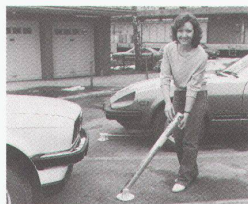
Auto aus per Fernsteuerung bedient werden kann.

Velopa-Produkte bestehen seit über 50 Jahren durch hohe Qualität. Die funktionale Bauweise ermöglicht eine äusserst einfache Installation. Die robuste Konstruktion und die fachmännische Verarbeitung gewährleisten eine lange Lebensdauer und Schutz gegen allfälligen Missbrauch. Das Absperrsystem-Programm von Velopa reicht von Absperrpfosten im Parkplatzbereich über Barrieren, Drehkreuze und Absperrgeländer bis hin zu Granitpollern für Fussgängerzonen. Verlangen Sie unseren Farbkatalog. Velopa AG, 8045 Zürich