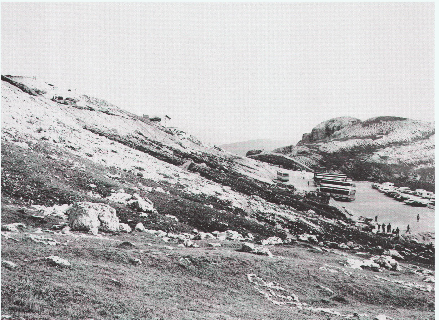
Rifugio Auronzo, 1991

Verschiebungen oder Überlappungen in einen oft flirrenden Zusammenhang mit den anderen Bildern des Gesamtableaus; wie überhaupt diese Massnahmen auf stupende Art den Gemeinplatz von der Fotografie als «Momentaufnahme» ausser Kraft setzen. Es sind die verschobenen Perspektiven der in die Landschaft gesetzten Pfähle, Masten, Schilder usw., die den Blick aus der Starre lösen, vor allem aber die sich in der Landschaft