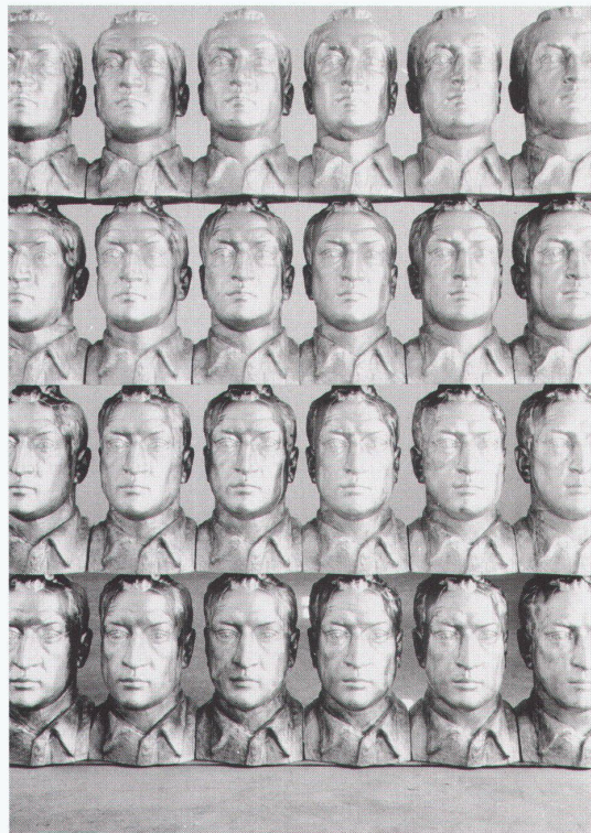
Wien, MAK – Österreichisches Museum für angewandte Kunst: Hans Kupelwieser, Trans-Formation

Lausanne, Musée des arts décoratifs Sièges en vedette 1972 à 1993 avec la collaboration du Musée Vitra bis 2.1.1995