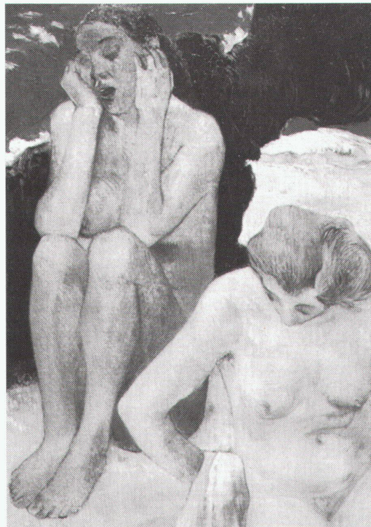
Paris, Musée d'Orsay: Paul Gauguin, La Vie et la Mort, 1889

München, Kunsthalle der Hypo-Kultur-Stiftung Edvard Munch und Deutsch- land bis 27.11.