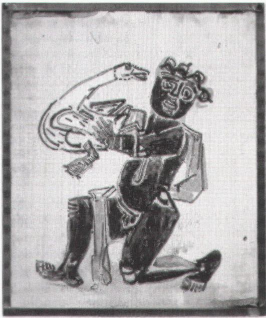
Halle, Staatliche Galerie Moritzburg: Charles Crodel, Hockender Knabe mit Gans, um 1970

Rotterdam, Museum Boymans-van Beuningen Dutch Drawings 1880–1850 bis 18.12.