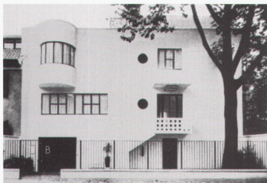
Haus Bomsel, 1925–1926, Architekt: André Lurçat

sondern konsequent ihm zu folgen suchten und entsprechend ihre Entwürfe formulierten und realisierten.