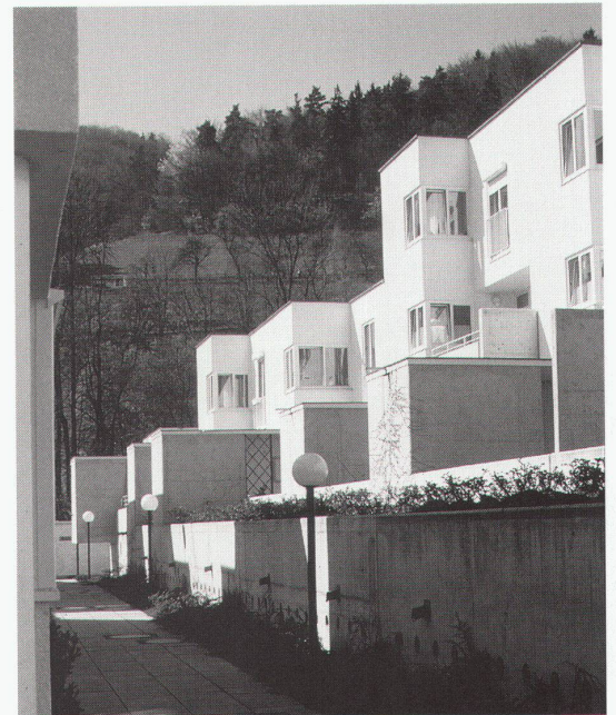
Wien, MAK – Museum für angewandte Kunst: Roland Rainer, Siedlung Leonfeldnerstrasse, Linz, Neue Heimat, 1986

Helsinki, Museum of Finnish Architecture Public Milieu. Survey of the building production of the National Board of Building bis 23.4.