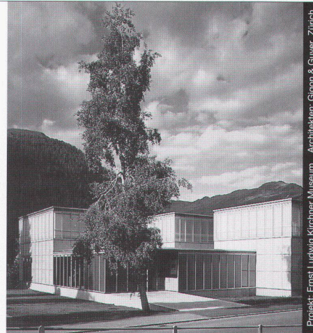
Projekt: Ernst Ludwig Kirchner Museum Architekten: Gligon & Guyer, Zürich

Ästhetik, Wirtschaftlichkeit und bauphysikalische Anforderungen in Einklang zu bringen, ist das Ergebnis ausgereifter Konstruktionen. Qualitätsbewusstsein und partnerschaftliche Zusammenarbeit sind nur einige der Voraussetzungen für ein gutes Gelingen in dieser vielfältigen Branche.