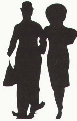
Zürich, Kunsthaus: 100 Jahre Film, Charles Chaplin, Modern Times