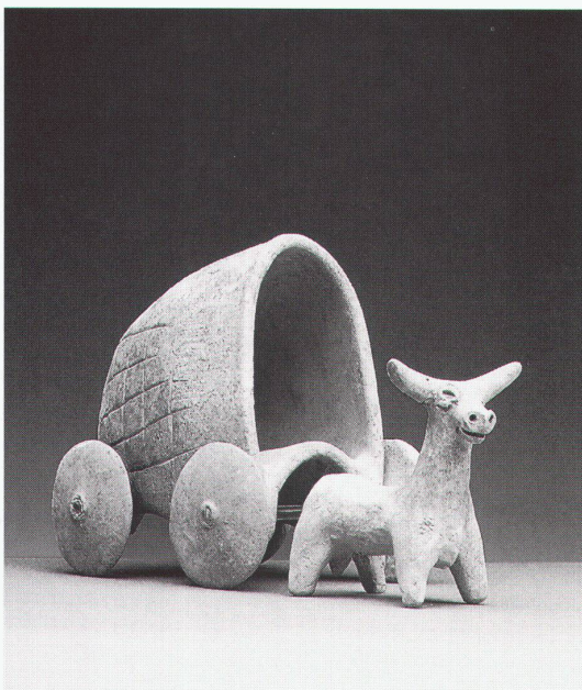
Chur, Rätisches Museum: Syrischer Planwagen, ca. 1500 v.Chr.

Braunschweig, Städtisches Museum Kunstschätze der Messestadt. Zur Ausstellung erscheint ein Journal, in dem die Fotos die Inszenierungen der Ausstellung festhalten (DM 5,-) bis 14.1.1996 Waldglas und Venezianerglas vom 15. bis 19. Jahrhundert bis 31.12.