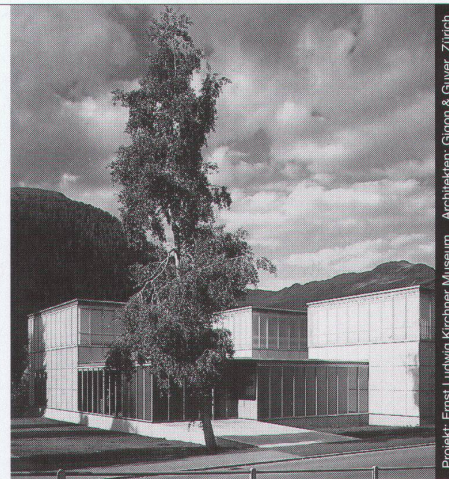
Projekt: Ernst Ludwig Krichmer Museum Architekten: Gigon & Guyer, Zürich

Ästhetik, Wirtschaftlichkeit und bauphysikalische Anforderungen in Einklang zu bringen, ist das Ergebnis ausgereifter Konstruktionen. Qualitätsbewusstsein und partnerschaftliche Zusammenarbeit sind nur einige der Voraussetzungen für ein gutes Gelingen in dieser vielfältigen Branche.