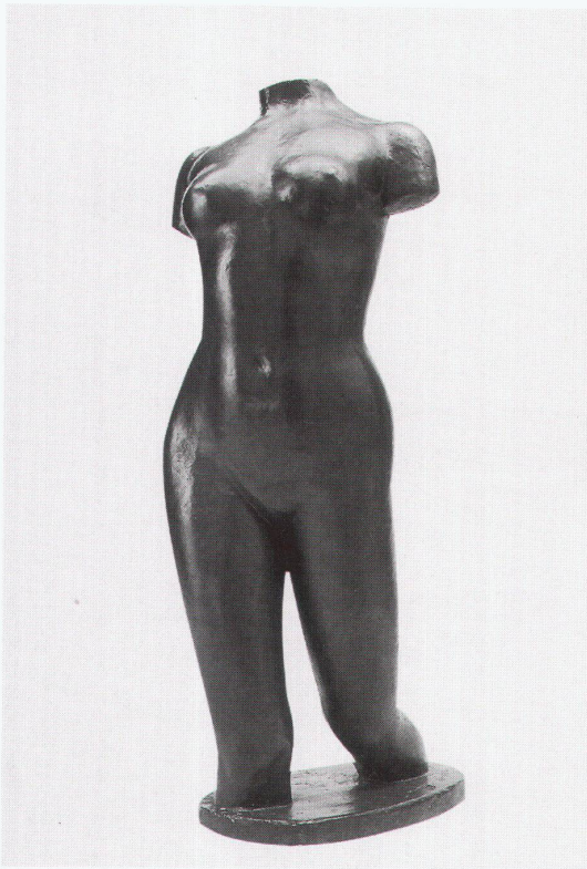
Lausanne, Musée Cantonal des Beaux-Arts: Aristide Maillol, Torse de l'Île-de-France, 1907–1921

Dresden, Staatliche Kunstsammlun- gen, Skulpturensammlung Bronzen der Renaissance und des Barock aus Dresdner Museumsbesitz bis 23.6.