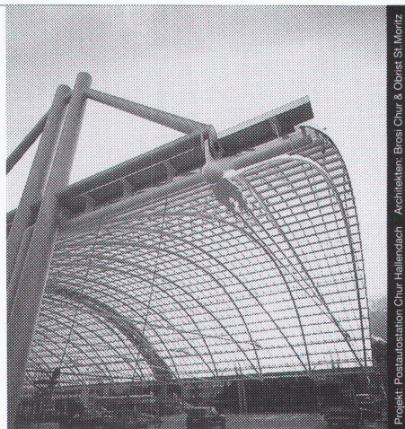
Projekt: Postausstation Chur, Halenndach - Architekten: Brossi Chur & Obrist St. Moritz

Stahl-Glas-Konstruktionen in architektonisch perfekter Vollendung verwirklichen wir mit innovativen Ideen und höchsten Anforderungen an Materialien und Ausführung.