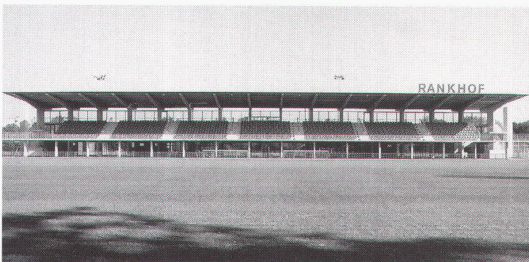
Fussballstadion Rankhof, Basel; Architekten: Michael Alder, Basel; Roland Naegelin

■ The architecture of stadiums, and of football stadiums in particular, is nowadays being confronted increasingly with multi-functional programmes. Whereas the combination of sports facilities with traditional urban functions means that the often expensive infrastructures can be exploited to the full, it also frequently leads to the stadiums being subjected to the pressure of commercial calculations. The special magic of the stadiums, however, ear-marks them as first and foremost places of play, and thus tinged with an unworldly uselessness. Two new stadiums illustrate the attempt to establish a link towards an architecture of festivities within the multi-purpose programmatic framework.