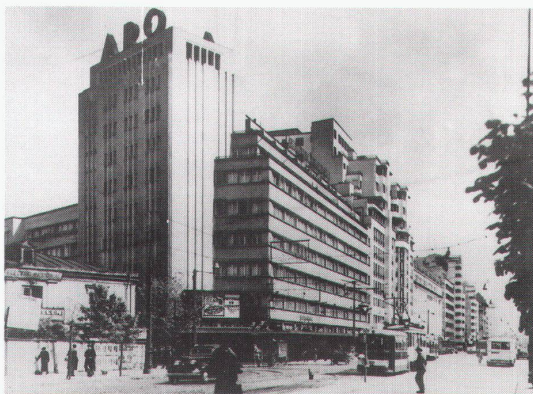
Zürich, ETH-Hönggerberg: Horia Greanga, «Aro»-Gebäude, 1929–1931

Diktatoren scheinen – geht man von den Merkma- len Massstabslosigkeit, Pa- thos, Kitsch, Heldenmythos und Monumentalität aus –