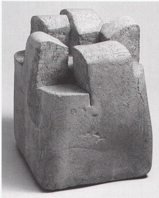
Zürich, Museum Bellerive: Eduardo Chillida, «Lurra G 180», 1990