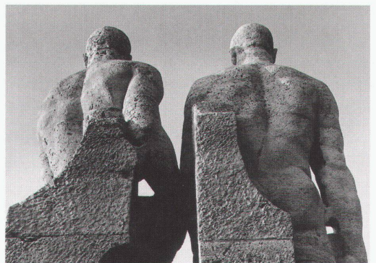
Olympiastadion Berlin: Olympische Helden, Rückenansichten