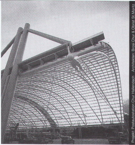
Projekt: Postautostation Chur, Hallendach. Architekten: Brossi Chur & Obrist St. Moritz.

Stahl-Glas-Konstruktionen in architektonisch perfekter Vollendung verwirklichen wir mit innovativen Ideen und höchsten Anforderungen an Materialien und Ausführung.