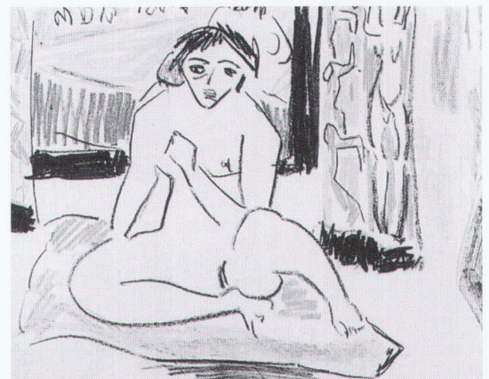
Ulm, Museum: Ernst Ludwig Kirchner, Weiblicher Akt vor dem Spiegel

München, Hypo-Kulturstiftung Picassos Sammlung anderer Künstler wie Balthus, Braque, Cézanne, Corot, Courbet, Degas, Matisse, Miró, Renoir, Rousseau und Bilder von ihm selbst 30.4.–16.8.