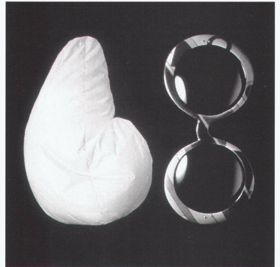
Düsseldorf, Kunstmuseum: Design und Alltagskultur

Weil am Rhein, Vitra Design Museum kid size – Möbel und Objekte für Kinder bis 1.6.