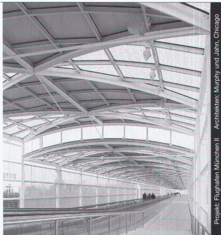
Projekt: Flughafent München II - Architekten: Murphy und Jann, Chicago

Stahl-Glas-Konstruktionen in architektonisch perfekter Vollendung verwirklichen wir mit innovativen Ideen und höchsten Anforderungen an Materialien und Ausführung.